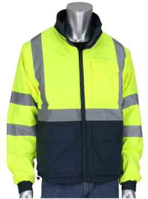
333-1500R CHAMARA REVERSIBLE 4 EN 1 ANSI TIPO R, CLASE 3 CON MANGAS DESMONTABLES 2 TONOS