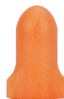
Mega T-Fit™ 67-HPF510C