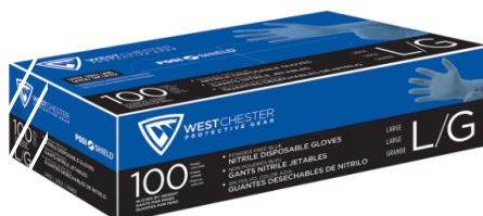
WESTCHESTER 2910 NITRILO DESECHABLE DE 4MM FDA COLOR AZUL