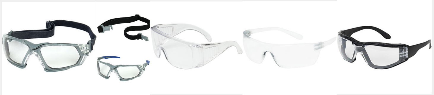
LENTE CONVERTIBLE 250-54-0520 Tecnología FogLess®3Sixty™.