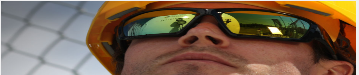
ZENON Z12 FOAM 2 50-01-F020 Proteccion vs Polvo