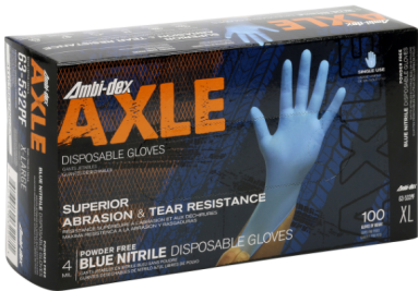
AMBI-DEX 63-532 PF NITRILODESECHABLE DE 4MM LIBRE DE POLVO FDA TEXTURIZADO