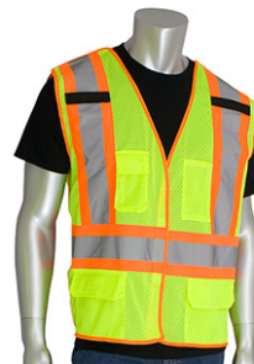
302-0212 CHALECO DE MALLA SEPARABLE DE CINCO BOLSILLOS ANSI TIPO R CLASE 2 DE DOS TONOS