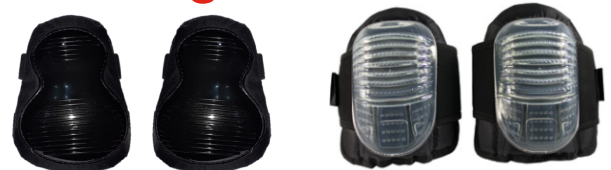
291-110 BLACK RODILLERA DE DOBLE PAD NEGRA