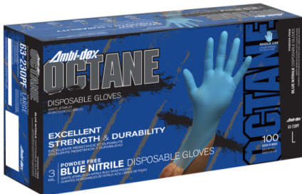
AMBI-DEX 63-230 PF NITRILO DESECHABLE DE 3MM LIBRE DE POLVO FDA